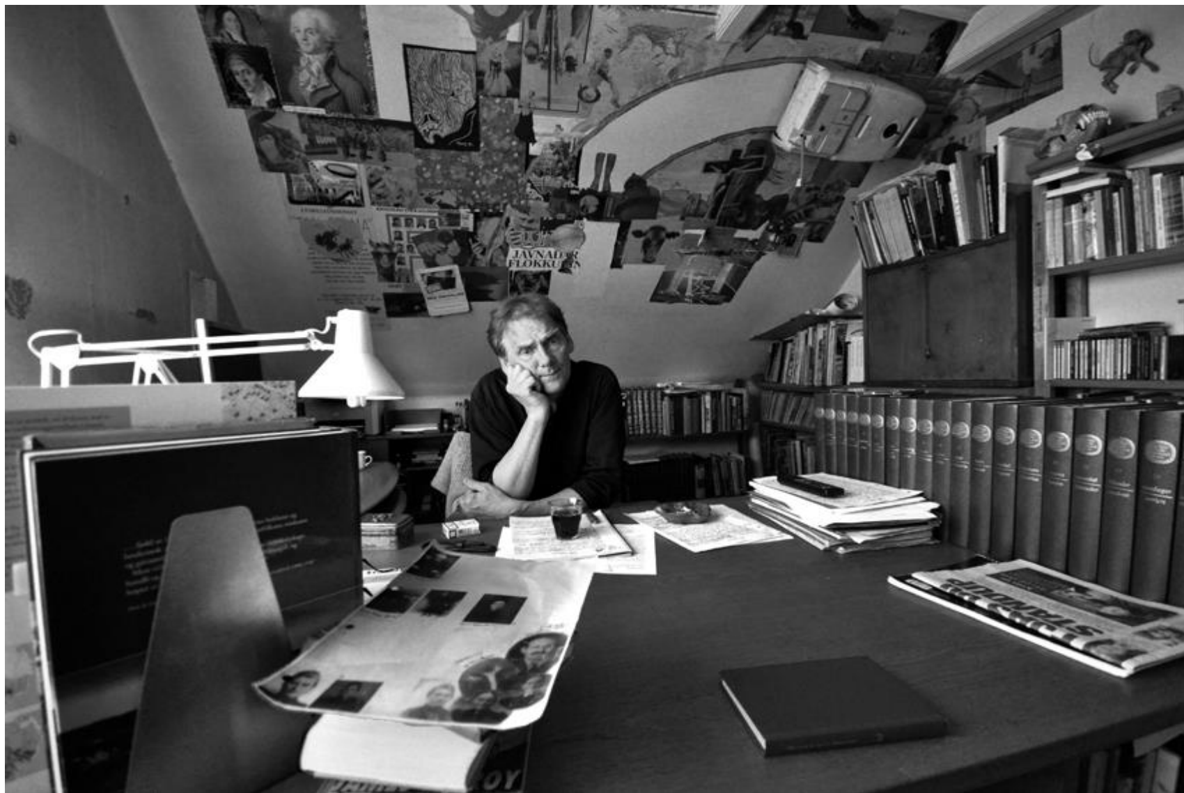
Bergur Djurhuus Hansen Fróðskaparsetur Føroya