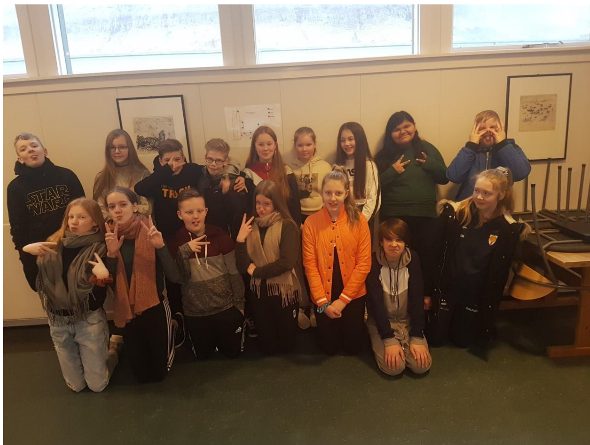
Granskarar: 6.flokkur í Sandoyar Meginskúla

HVÍ MAN VENDUR Á HØVDINUM, TÁ IÐ MAN HYGUR Í EINA SKEIÐ?