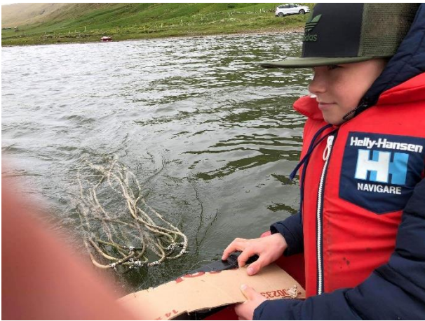
Vit gera eina línu sum vit seta á Sandsvatni.