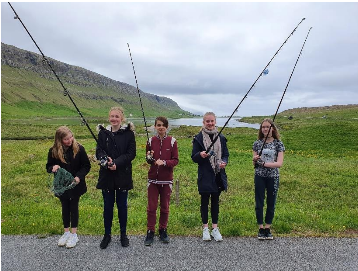
Vit fara at fiska við tráðu og línu.