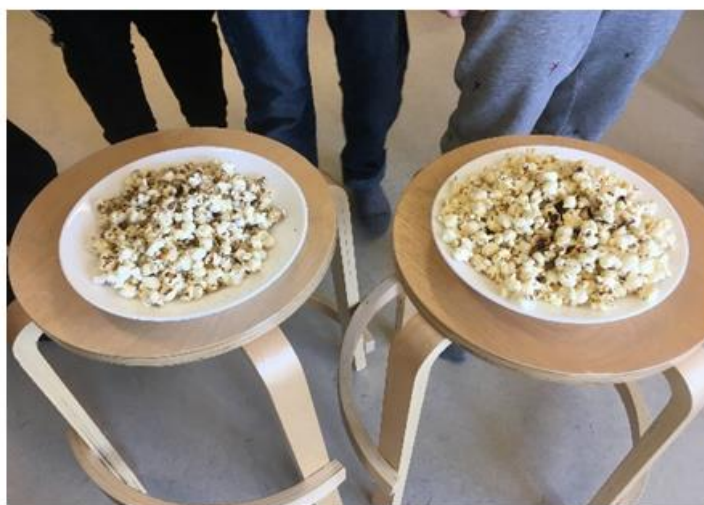
Hesi eru gjørd við smør og olju