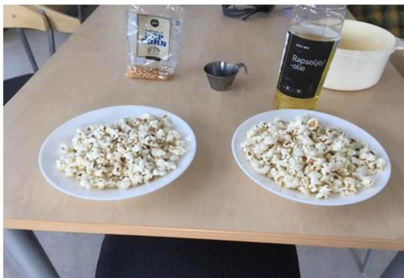
Hesi eru gjørd í mikroovninum