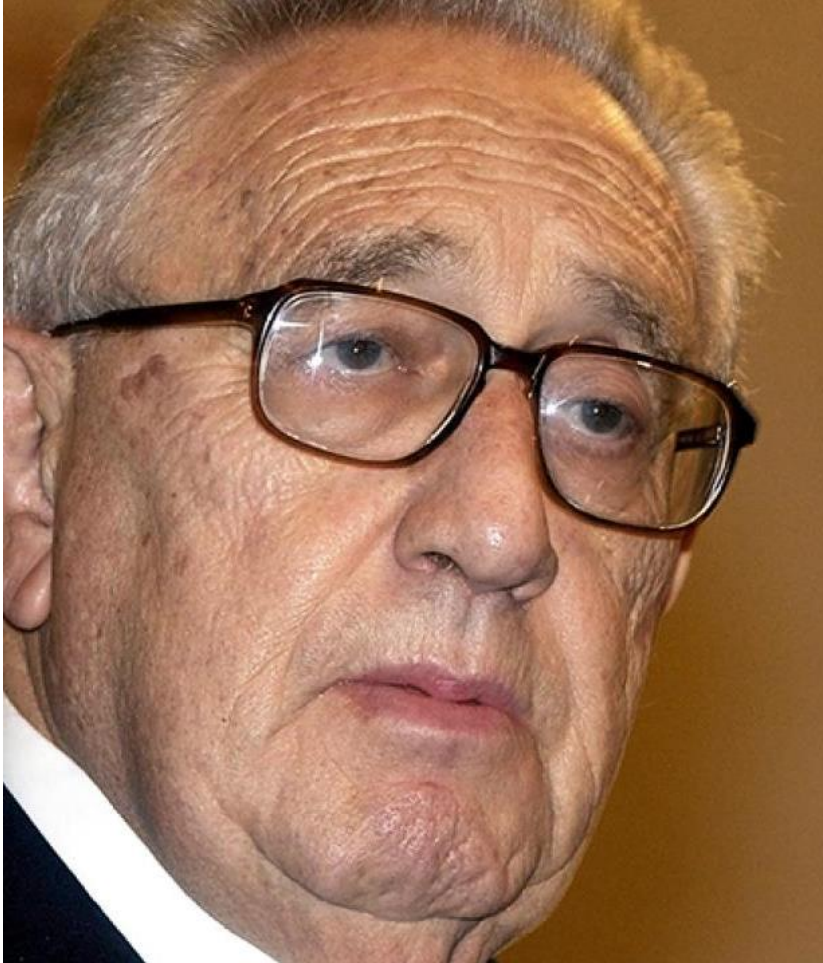
Henry Kissinger, trygðarpolitískur ráðgevi hjá Richard Nixon og uttanríkisráðharri hjá Gerald Ford.