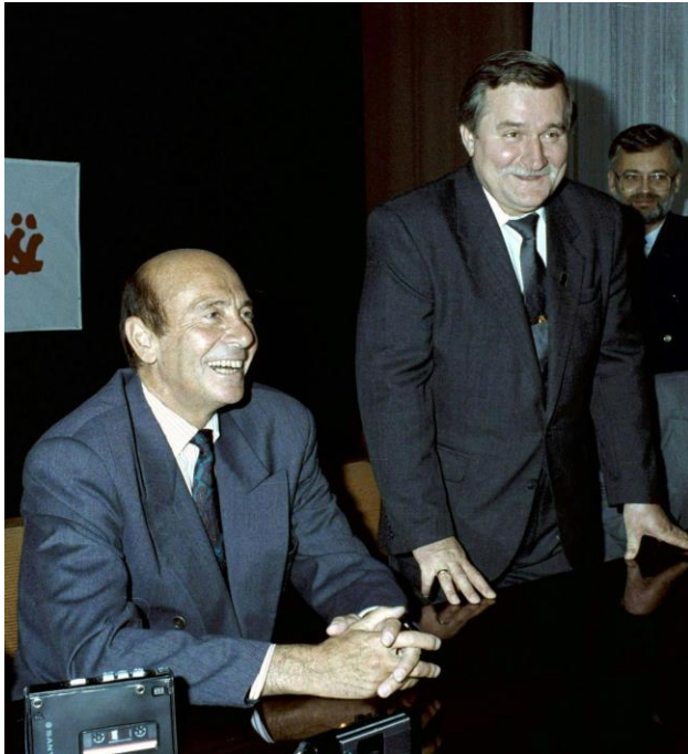
Manfred Wörner (vm), sum var NATO aðalskrivari, og Lech Walesa, leiðari fyri Solidaritet, sum gjørdist forseti í Póllandi eftir kalda kríggið. Myndin er frá vitjan í Gdansk í Póllandi 13. september 1990.